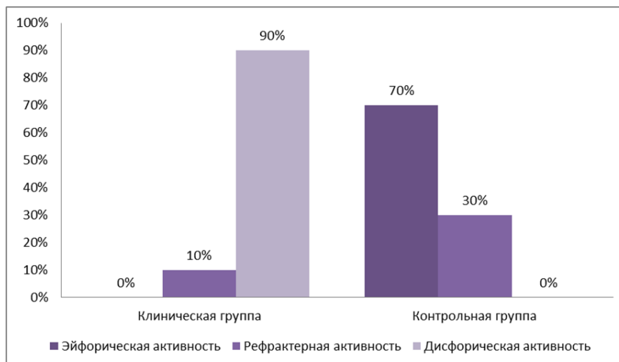
Рисунок 3 – Взаимосвязь склонности к алкогольной зависимости и типа эмоциональной реакции подростков

Наглядное представление взаимосвязи склонности к алкогольной зависимости и типа эмоциональной реакции подростков, см. рис. 3.