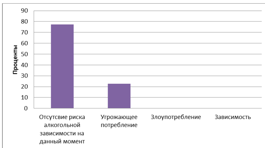
Рисунок 1 – Вероятность алкогольной зависимости у подростков

На первом этапе нашего исследования, мы провели тестирование по методике ВОЗ для выявления вероятности возникновения алкогольной зависимости у учащихся 7-ых классов, см. рис. 1.